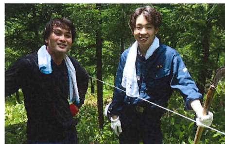
町の工務店の後継者たち(6月の林業研修で)

普通科の高校だったのでカレッジで基本を学ぶことにしました。あと4か月で卒業です。密度の濃いカレッジの2年間は、知識と技術、そして仲間たち。一生の宝物を2人に提供しました。