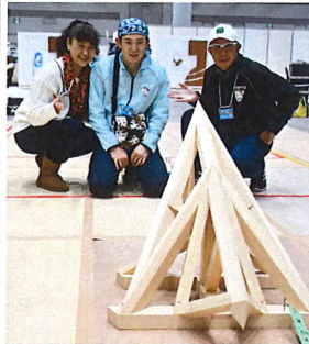
ご両親と一緒に 記念撮影