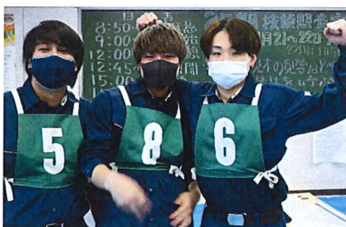
試験開始前にガッツポーズ

お問い合わせ・入学相談は ☎03-5950-1771 東京土建技術研修センター内、 東京建築カレッジ