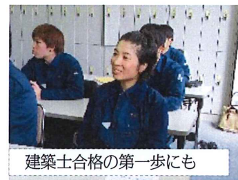
建築士合格の第一歩にも

東京建築カレッジの今年4月入学生募集は、入学選考会があと1回、2月23日（水）となりました。応募はまだ間に合います。新入社員、お子さん・お孫さんに、建築の仕事の魅力、やりがいをおカレッジで学んでもらいたいです。お気軽にお問い合わせ、ご相談ください。