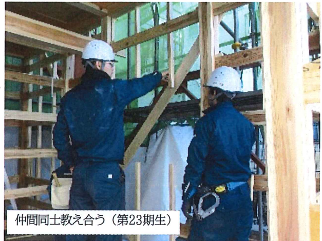
仲間同士教え合う（第23期生）

東京建築カレッジの今年4月入学生募集は、入学選考会があと1回、2月23日（水）となりました。応募はまだ間に合います。新入社員、お子さん・お孫さんに、建築の仕事の魅力、やりがいをおカレッジで学んでもらいたいです。お気軽にお問い合わせ、ご相談ください。