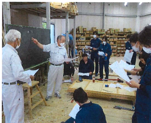
学校の母体、東京土建の組合員さんが各専門工事の体験の機会を提供してくれます。写真は、型枠・鉄筋授業(5月26日)

本校の実技実習の多くは大工技術ですが、2年次の前期には7つの各専門工事職の施工体験授業を設けています。建築現場を統括する管理者レベルをめざすには大工以外の仕事の理解も欠かせないからです。型枠・鉄筋、左官(モルタル、漆喰、塗り、水道設備、塗装、襖(ふす