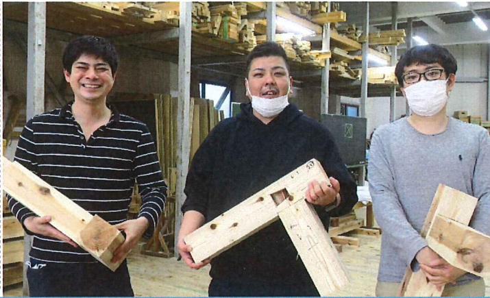
入学したから出会えた新しい仲間! (5月14日の放課後、江東実習場で)