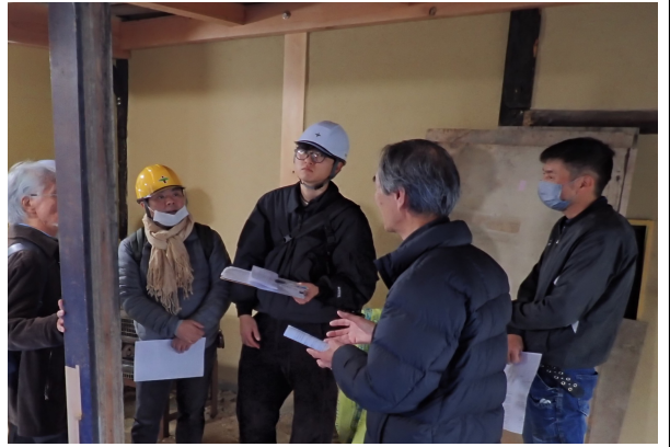
「奈良宿泊研修」で大規模改修工事現場を見学(橿原市今井町)。リフォーム・リノベーション工事は今後ますます増えていく。古民家の魅力を生かす事例に刺激を受けた。

を積みながら、少しずつ経営の視点も学んでいきたいです。10年後には、地域の人にとって「この人」家を任せたい」と思われるような存在になりたい。そして、建築を通して地域の豊かさを支えるような活動にも取り組んでいきたいです。