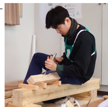
左写真：技能照査実技試験で「化粧棒隅木」製作に奮闘中。

議論や切磋琢磨した時間です。年齢差を感じる交流の中で価値観の違いを知り、自分の軸がより明確になりました。